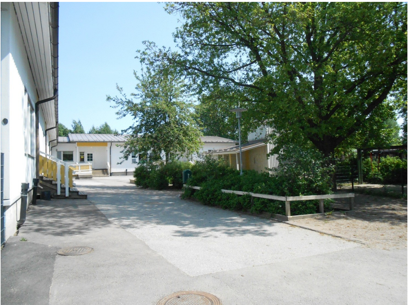
Kurjenpolven päiväkoti Lauhatiellä

Okariina on entisestä omakotitalosta saneerattu ryhmäperhepäiväkoti. Okariinassa on paikkoja 1-5-lapsille.