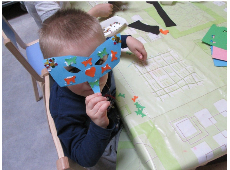
Kädentaidot: maalaaminen, askartelu, piirtäminen, hamahelmet, helmien pujottelu, muovailu, värittäminen.