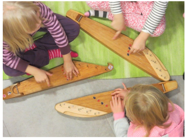
Musiikki: laulut, lorut, soittimet, tanssi, kehorytmit, kuuntelu, musiikkiliikunta.