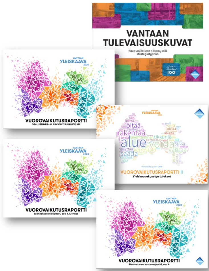
Kuva 4. Yleiskaavaprosessin aikana laaditut vuorovaikutusraportit

Kaikista edellä mainituista vuorovaikutusvaiheista on koostettu omat vuorovaikutusraporttinsa. Näiden vuorovaikutustilanteiden lisäksi yleiskaavaa on käyty esittelemässä useissa eri neuvottelukunnissa, tapahtumissa ja työryhmissä.