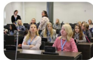
Lasten ja nuorten vaikuttajapäivä Nuorisopalvelut Kaupunkisuunnittelu