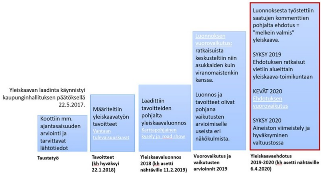
Kuva 1. Yleiskaavaprosessin kulku ja vuorovaikutuksen vaiheet

Keväällä 2017 käynnistettiin Suomi 100-teemavuoteen liittyvä Vantaan Tulevaisuuskuvat-työ, jossa koottiin asukkaiden näkemyksiä Vantaan pitkän tähtäimen näkymistä. Työn tuloksia käytettiin mm. yleiskaavan tavoitteiden laadinnan tausta-aineistona (Vantaan kaupunki 2017).