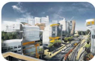
Vantaan tulevaisuuskuvat Kaupunkisuunnittelu

Kaupunki kokosi asukkaiden näkemyksiä Vantaan pitkän tähtäimen suunnista keväällä 2017