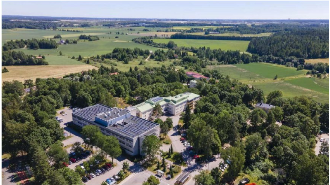
Kuva 1. Seutulankatu arvokas jokilaaksomaisema.

1 https://www.vantaa.fi/sites/default/files/matti/1023341-1045037-030800%20Kulttuuriymp%C3%A4rist%C3%B6selvitys%2018.4.2023.pdf