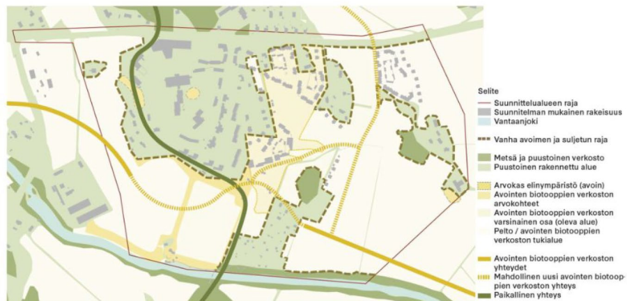
Maisematilojen rakenne. Maankäytön viitesuunnitelma; Nomaji maisema-arkkitehdit, Arkkitehdit Tommila, WSP Finland