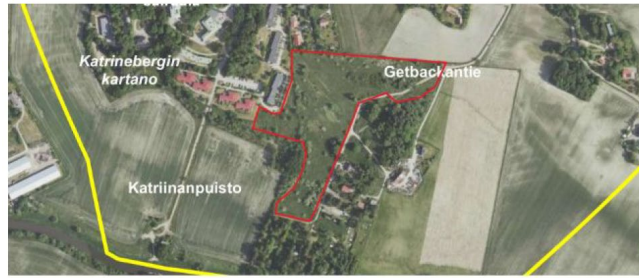
Kuva 3. Potentiaalinen arvokas niittyalue (punainen rajaus), jonka luontoarvot tulee selvittää ennen kaavan jatkovaiheita.