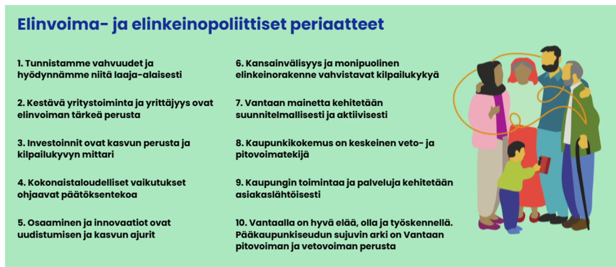
Kuva 3: Luonnos, Elinvoima- ja elinkeinopoliittisten periaatteiden tiivistelmä, päätösprosessissa KV 22.6.2026.

Ohjelmatyö sysää liikkeelle pitkäaikaisen toimintakulttuurin muutoksen, mutta vaikuttavia toimenpiteitä valikoidaan myös strategiakauden välittömät tarpeet huomioiden. Ohjelmatyö hyödyntää kumppanuudet ja verkostot, joista kaupunkiorganisaatio saa tukea ja voimaa haasteiden ratkomiseen.