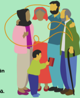
Kuva 3: Luonnos, Elinvoima- ja elinkeinopoliittisten periaatteiden tiivistelmä, päätösprosessissa KV 22.6.2026.