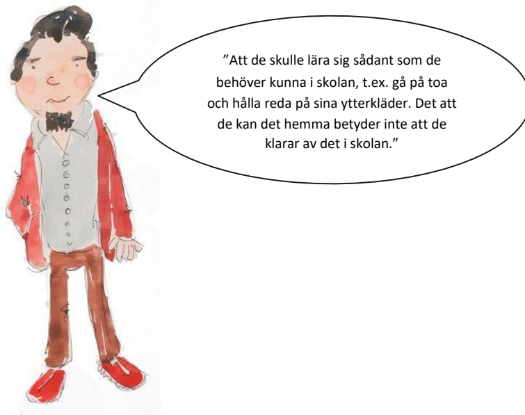
Förälderns svar på vad vardagskompetens kunde innebära

I förskoleundervisningen ska barnen utifrån sina förutsättningar lära sig ta ansvar för sig själva och andra, för sina saker och den gemensamma miljön. Barnens vardagsrytm och betydelsen av måltider och vila ska tas upp i undervisningen och med vårdnadshavarna. Särskild vikt ska fästas vid mångsidig och tillräcklig motion som en förutsättning för barnens lärande och välbefinnande. Med barnen diskuteras vad som inverkar positivt respektive negativt på deras välbefinnande. Barnen ska få lära sig att röra sig tryggt i trafiken. De ska uppmuntras att be om och söka hjälp vid behov. Tillsammans med barnen provar man på tekniska lösningar och ger dem övning i att använda apparater och utrustning på ett tryggt sätt.