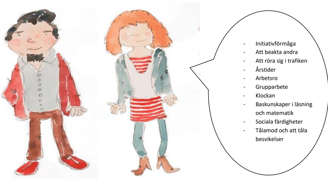
Föräldrarnas synpunkter på vad barnen kunde lära sig i förskolan